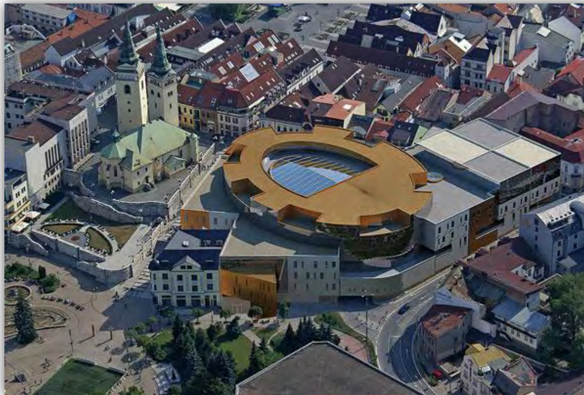
Obchodné centrum Mirage v Žiline – vizualizácia http://www.asb.sk/?gallery=4351&image=32781